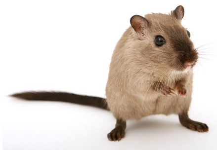
UNE SOURIS une souris