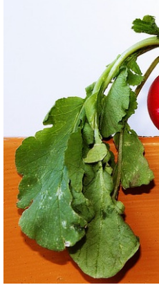
DES FEUILLES (de radis) des feuilles (de radis)