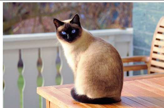
UN CHAT un chat