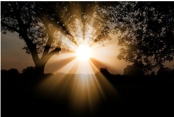
LE SOLEIL le soleil