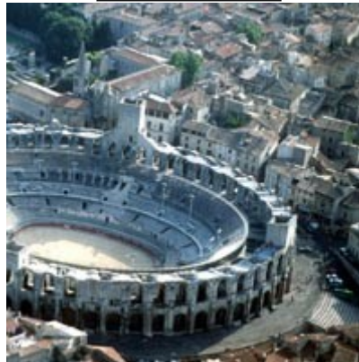
Arènes de Nîmes

L' arène est l'espace sablé au centre des amphithéâtres, là où combattaient les gladiateurs.