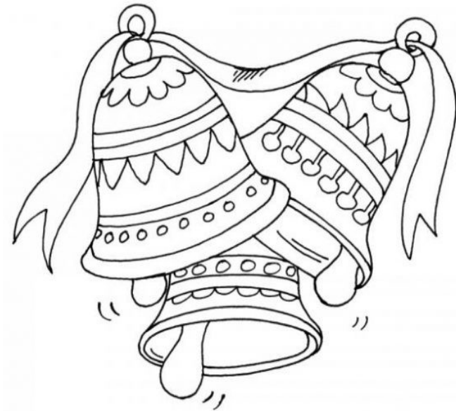
LAS CAMPANAS Las campanas Las campanas