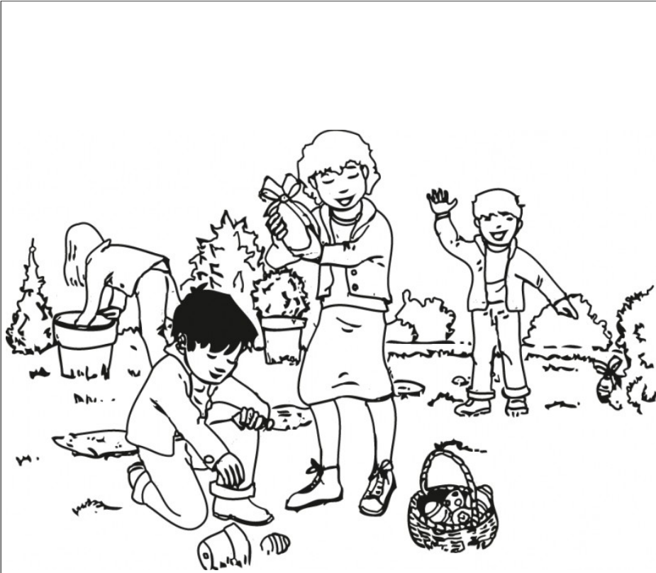
LA BÚSQUEDA La búsqueda La búsqueda